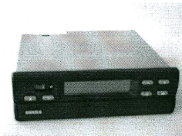
Тахограф KIENZLE 1324