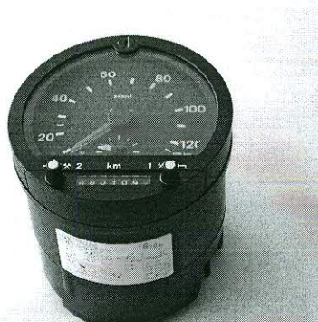
Тахограф KIENZLE 1318

В тахографе KIENZLE 1324 предусмотрена функция световая сигнализации при превышении допустимого значения скорости. При превышении установленной скорости либо отсутствии тахограмм значение скорости на жидкокристаллическом табло начинает мигать. Открытие крышки тахографа фиксируется на тахограмме прерывающейся линией. Внешний вид тахографов KIENZLE 1318, 1319, 1324 приведен на рис.1.