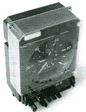
Тахограф KIENZLE 1319