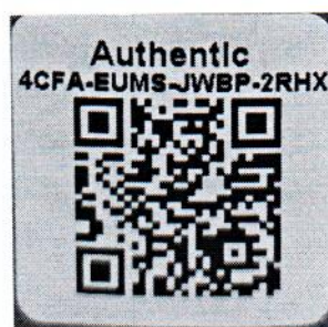
Рисунок 1.2 – Фотография маркировки манометра дифференциального показывающего Magnehelic 2000-500PA № 4CFA-EUMS-JWBP-2RHX