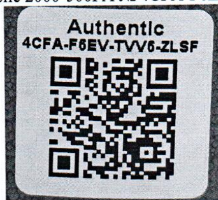
Рисунок 1.2 – Фотография маркировки манометра дифференциального показывающего Magnehelic 2000-500PA № 4CFA-F6EV-TVV6-ZLSF