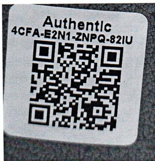
Рисунок 1.2 – Фотография маркировки манометра дифференциального показывающего Magnehelic 2000-500PA № 4CFA-E2N1-ZNPQ-82IU