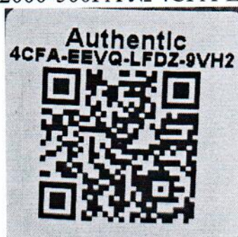
Рисунок 1.2 – Фотография маркировки манометра дифференциального показывающего Magnehelic 2000-500PA № 4CFA-EEVQ-LFDZ-9VH2