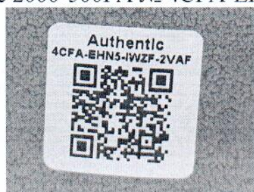
Рисунок 1.2 – Фотография маркировки манометра дифференциального показывающего Magnehelic 2000-500PA № 4CFA-EHN5-IWZF-2VAF