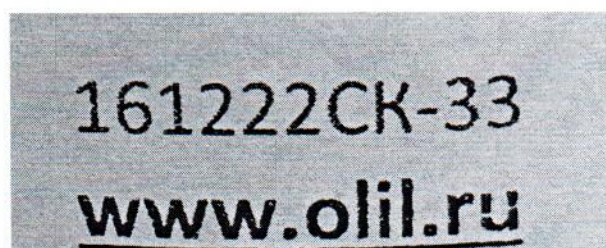
Рисунок 1.2 – Фотография маркировки манометра дифференциального показывающего Magnehelic 2000-60PA № 161222СК-33