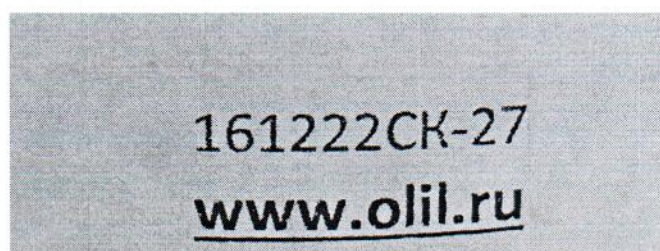
Рисунок 1.2 – Фотография маркировки манометра дифференциального показывающего Magnehelic 2000-60PA № 161222СК-27