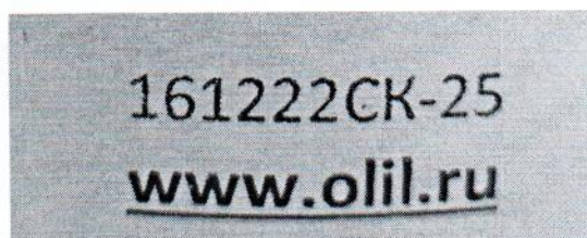
Рисунок 1.2 – Фотография маркировки манометра дифференциального показывающего Magnehelic 2000-60PA № 161222СК-25