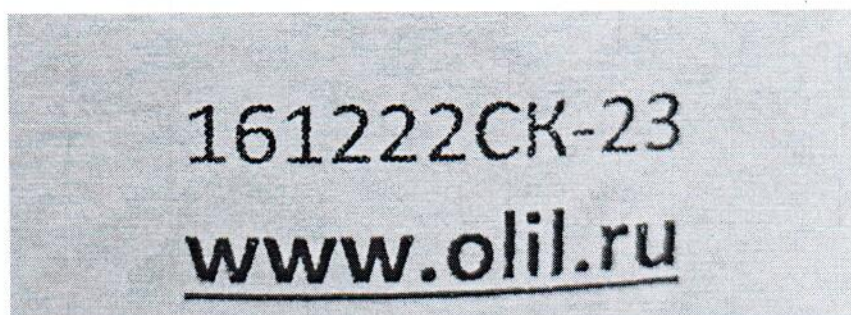
Рисунок 1.2 – Фотография маркировки манометра дифференциального показывающего Magnehelic 2000-60PA № 161222СК-23