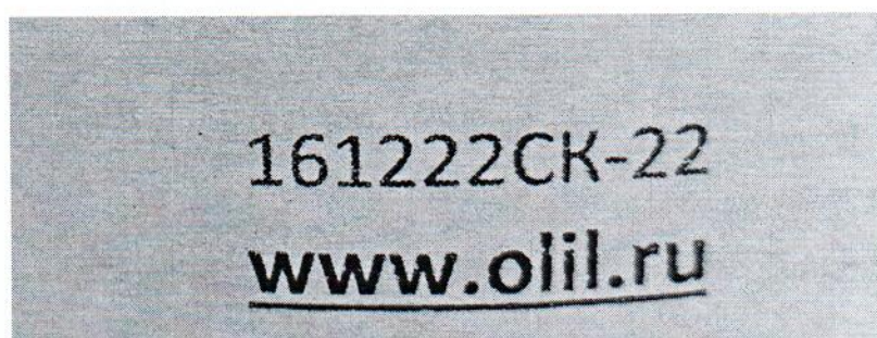
Рисунок 1.2 – Фотография маркировки манометра дифференциального показывающего Magnehelic 2000-60PA № 161222СК-22