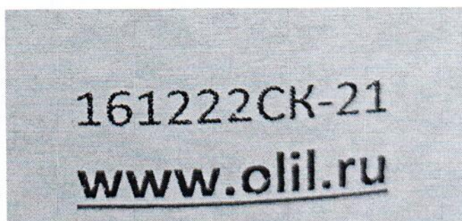
Рисунок 1.2 – Фотография маркировки манометра дифференциального показывающего Magnehelic 2000-60PA № 161222СК-21