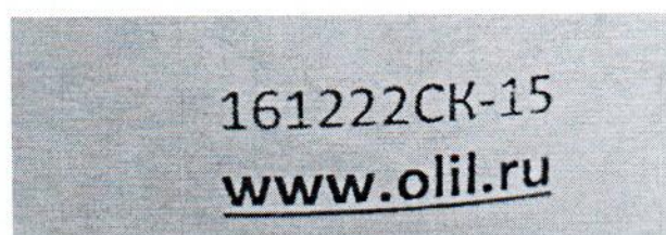
Рисунок 1.2 – Фотография маркировки манометра дифференциального показывающего Magnehelic 2000-60РА № 161222СК-15