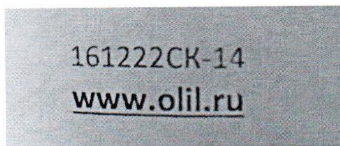
Рисунок 1.2 – Фотография маркировки манометра дифференциального показывающего Magnehelic 2000-60PA № 161222СК-14