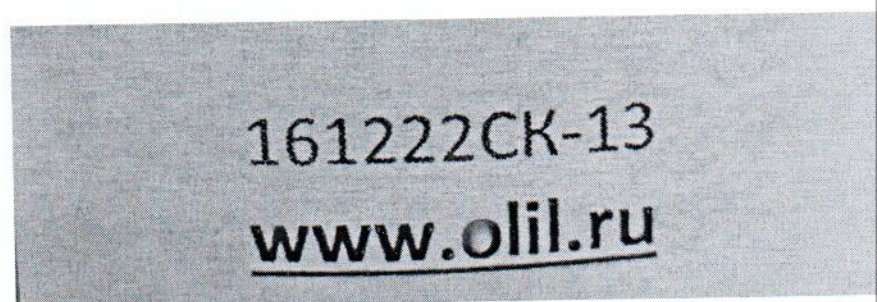
Рисунок 1.2 – Фотография маркировки манометра дифференциального показывающего Magnehelic 2000-60РА № 161222СК-13