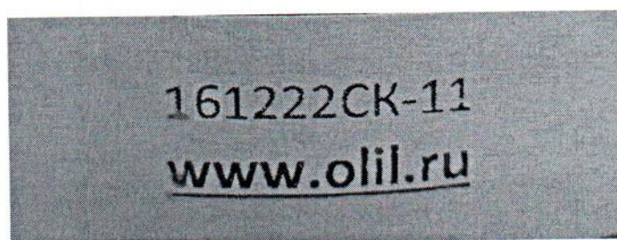
Рисунок 1.2 – Фотография маркировки манометра дифференциального показывающего Magnehelic 2000-60РА № 161222СК-11