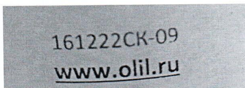
Рисунок 1.2 – Фотография маркировки манометра дифференциального показывающего Magnehelic 2000-60РА № 161222СК-09