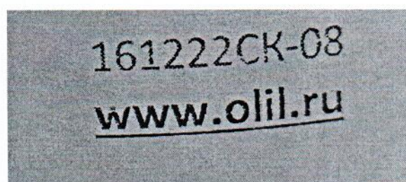
Рисунок 1.2 – Фотография маркировки манометра дифференциального показывающего Magnehelic 2000-60PA № 161222СК-08