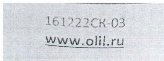
Рисунок 1.2 – Фотография маркировки манометра дифференциального показывающего Magnehelic 2000-60PA № 161222СК-03