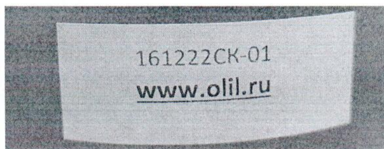
Рисунок 1.2 – Фотография маркировки манометра дифференциального показывающего Magnehelic 2000-60РА № 161222СК-01