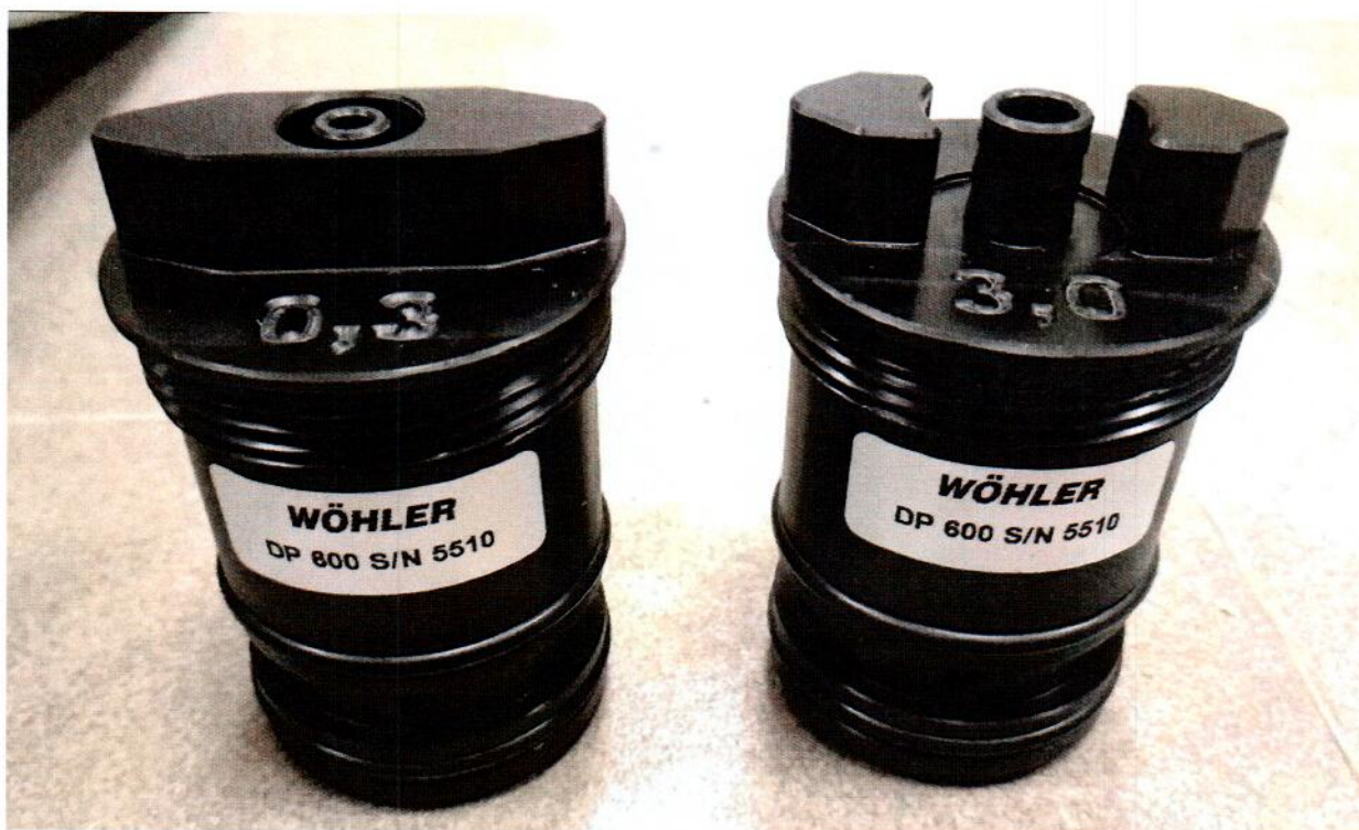
Рисунок 1.3 – Фотография общего вида и маркировки адаптеров «0,3» и «3,0» из комплекта прибора