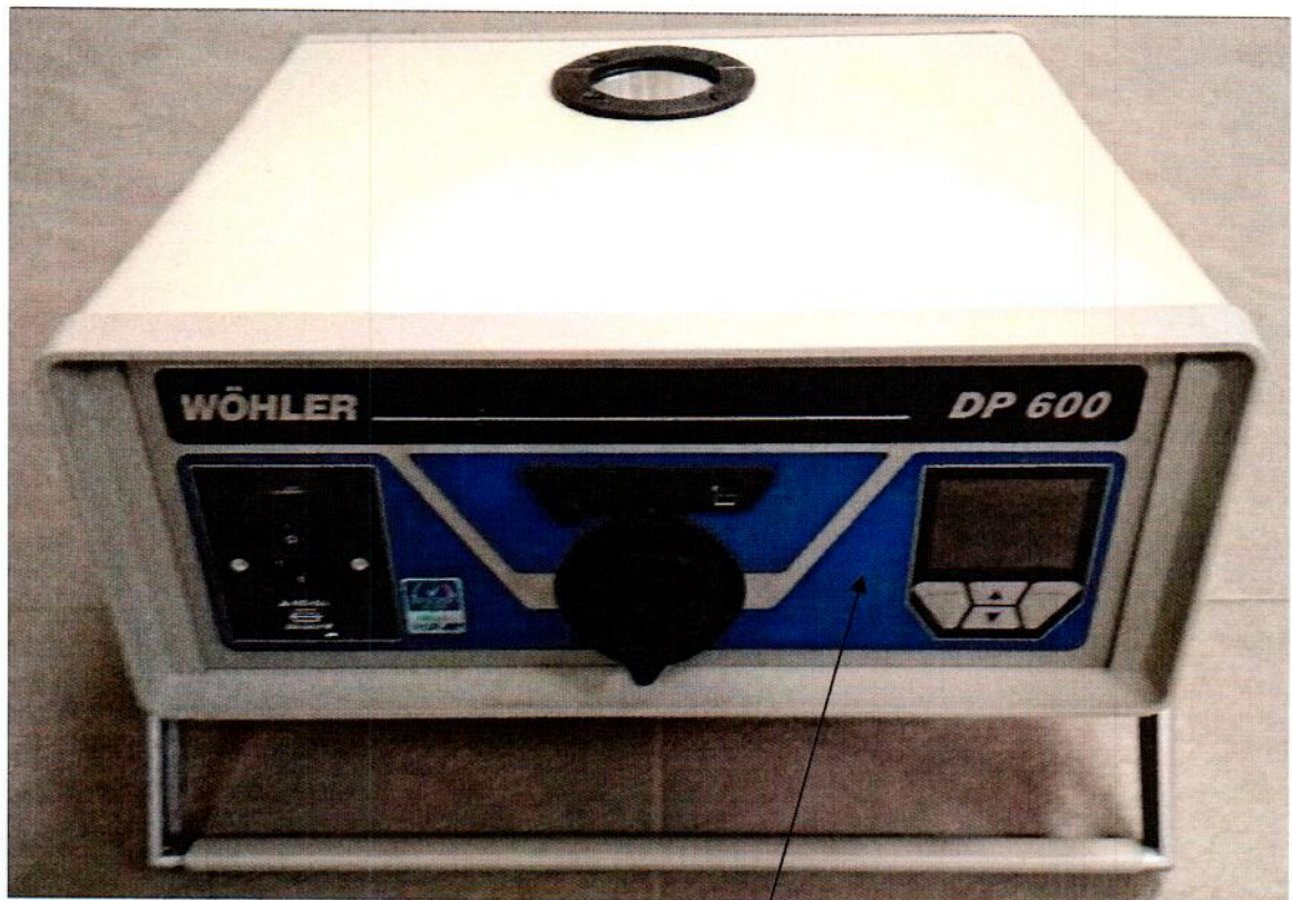
Схема (рисунок) с указанием места для нанесения знака поверки средств измерений

Место для нанесения знака поверки средств измерений