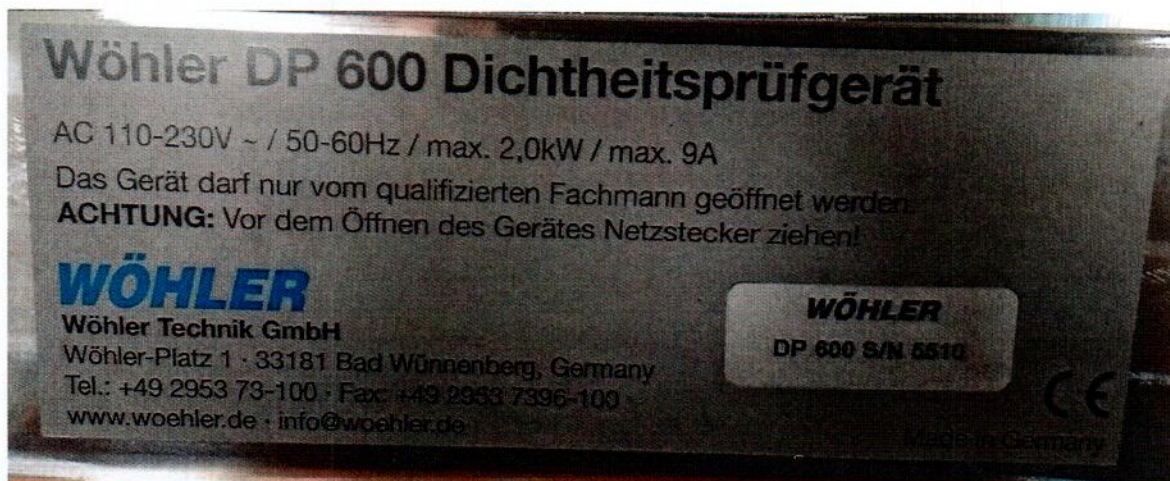
Рисунок 1.2 – Фотографии маркировки прибора