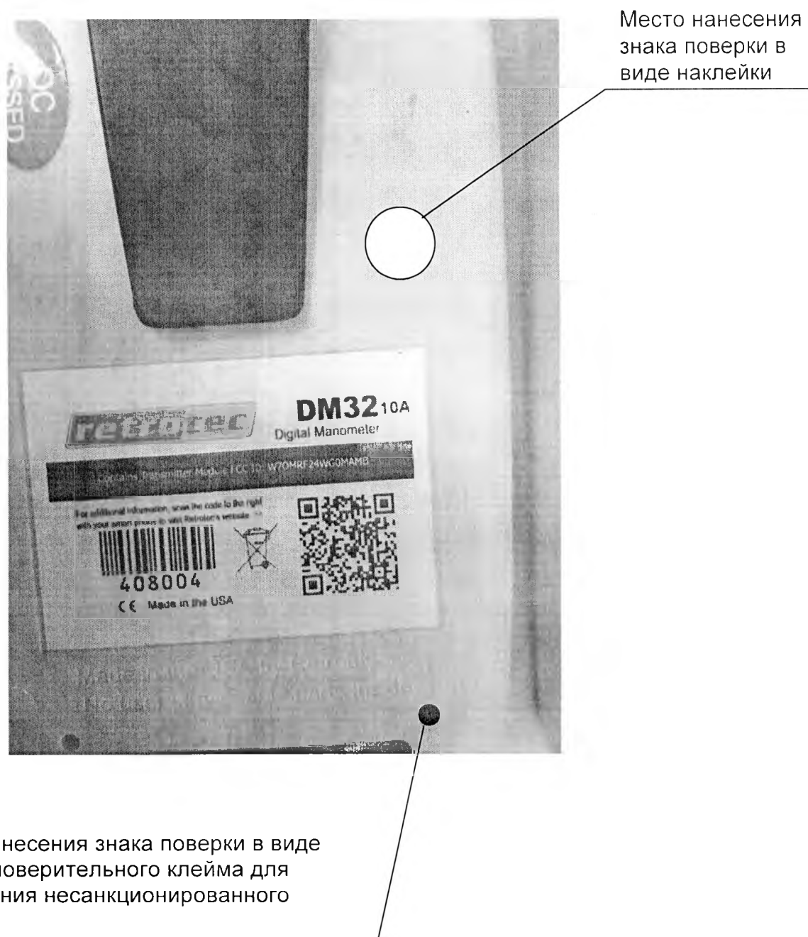
Рисунок А.1 – Место нанесения знака поверки (задняя панель манометра)