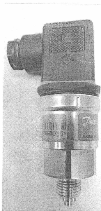
MBS 3000, MBS 3050