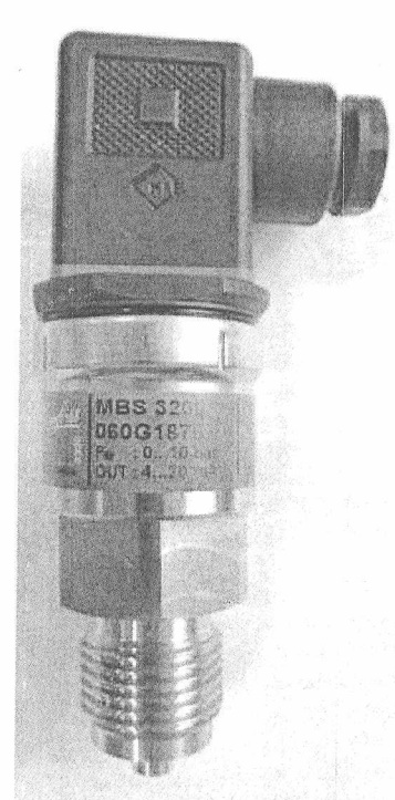
MBS 3200, MBS 3250