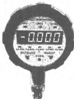
Рисунок 1 - Фотография общего вида приборов

Фотография общего вида приборов приведена на рисунке 1.