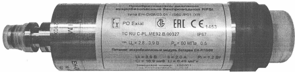
Рисунок 1 – Внешний вид преобразователя давления искробезопасного беспроводного RPSI EH-O/08/03.01

Внешний вид преобразователя давления приведен на рисунке 1.