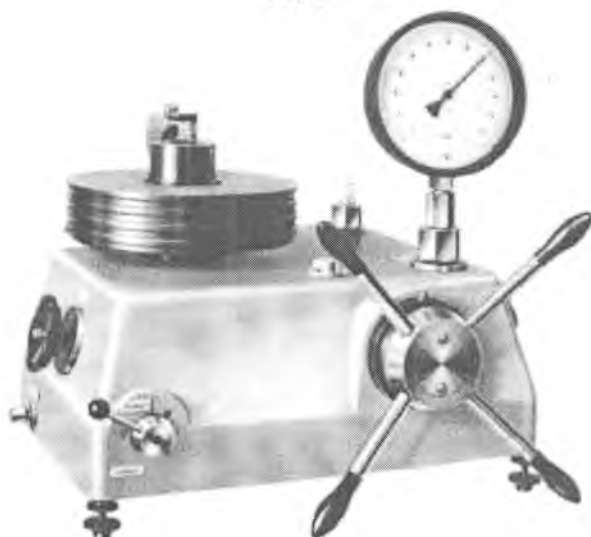
PD 60, PD 100