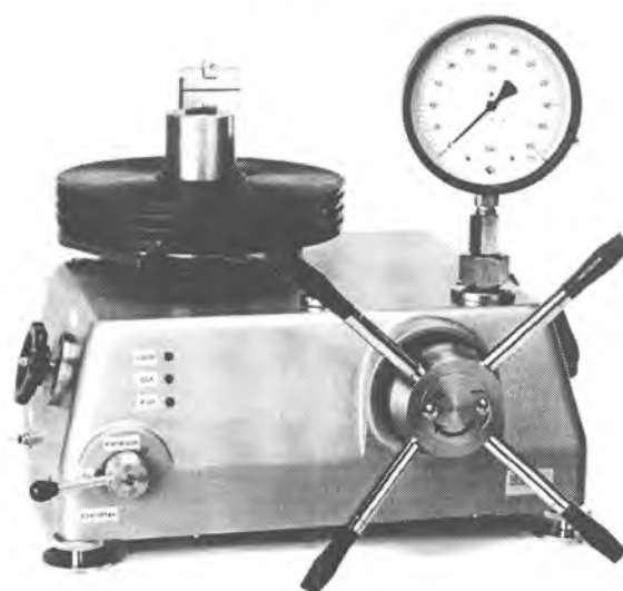
PD 600, PD 1000