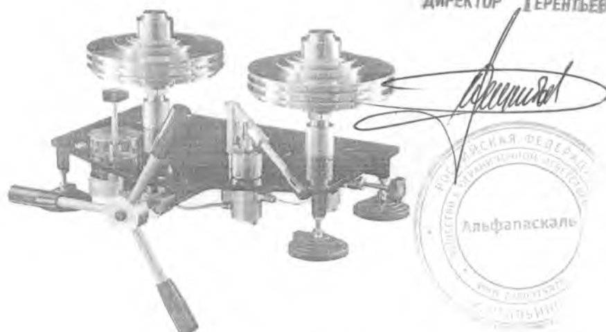
Рис. 2 Манометры грузопоршневые МП (УСД специального исполнения)