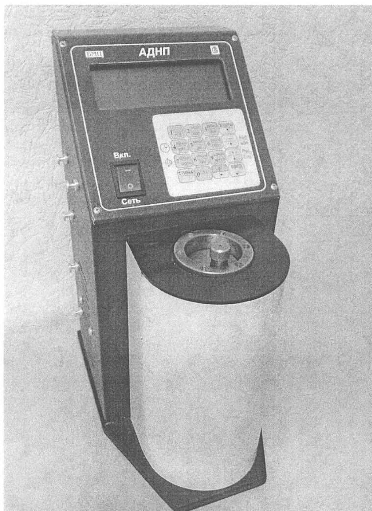
Рис. 1 Внешний вид анализатора АДНП.

Внешний вид анализатора приведен на рисунке 1.