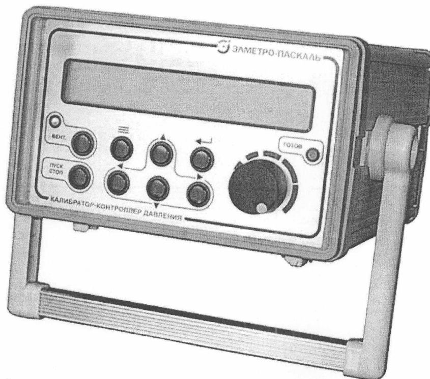
Рисунок 1 – Общий вид КД