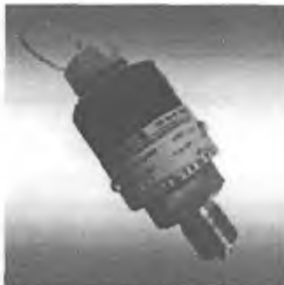
Фото 1 - Фотография общего вида преобразователей давления ТП-140Д

Фотографии общего вида преобразователей давления ТП-140Д и ТП-140Д(М) приведены на фото 1 и 2.