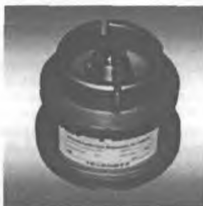
Фото 2 - Фотография общего вида преобразователей давления ТП-140Д(М)