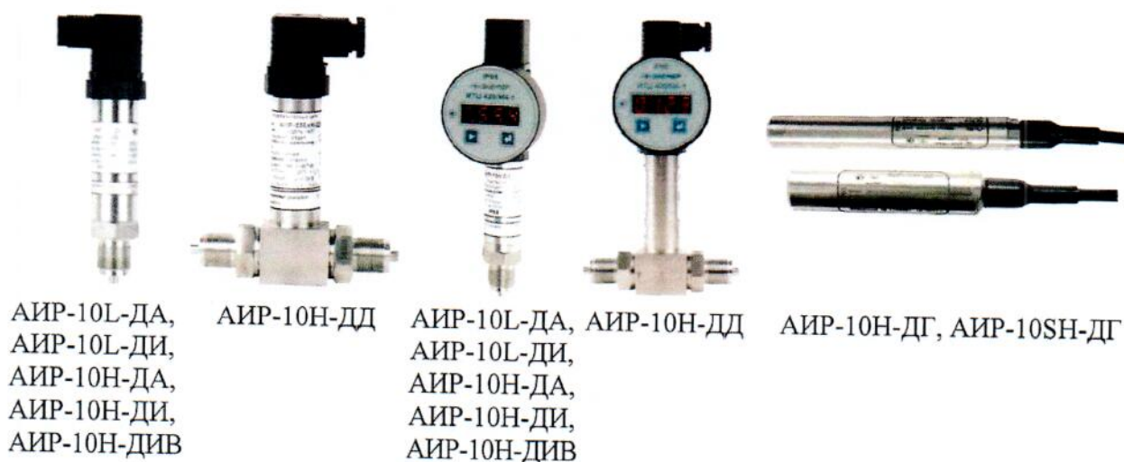
Рисунок 1 – Общий вид преобразователей давления измерительных АИР-10

Схема пломбировки от несанкционированного доступа представлена на рисунке 3.