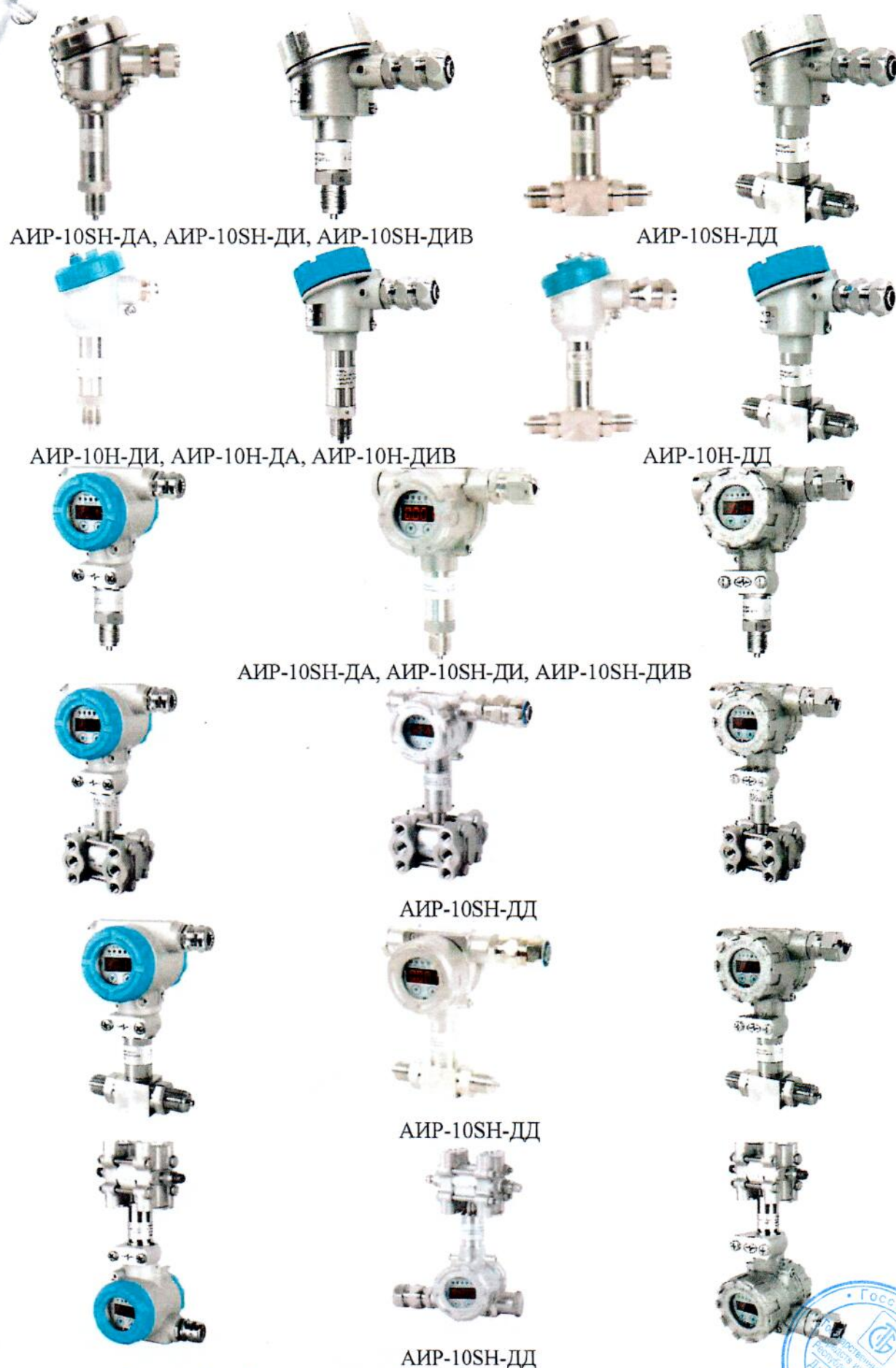
Рисунок 2 – Общий вид преобразователей давления измерительных АИР-10