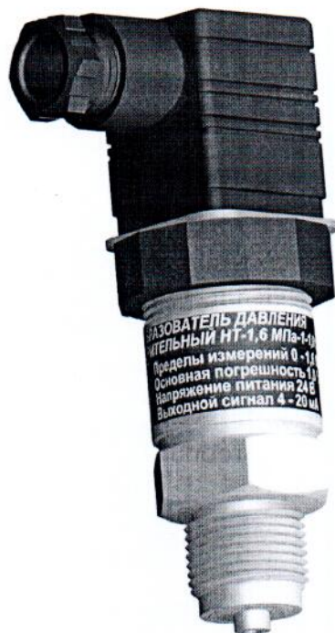
Рисунок 1. Фотография общего вида датчика

Поверительное клеймо наносится на паспорт датчика.