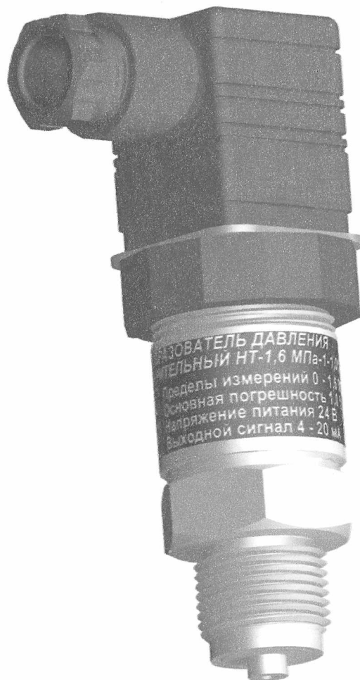
Рисунок 1. Фотография общего вида датчика