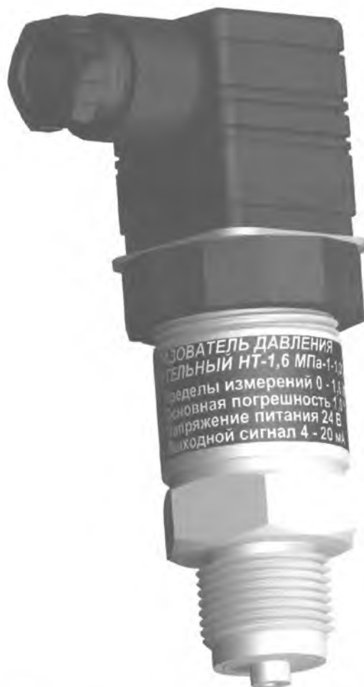
Рисунок 1. Фотография общего вида датчика