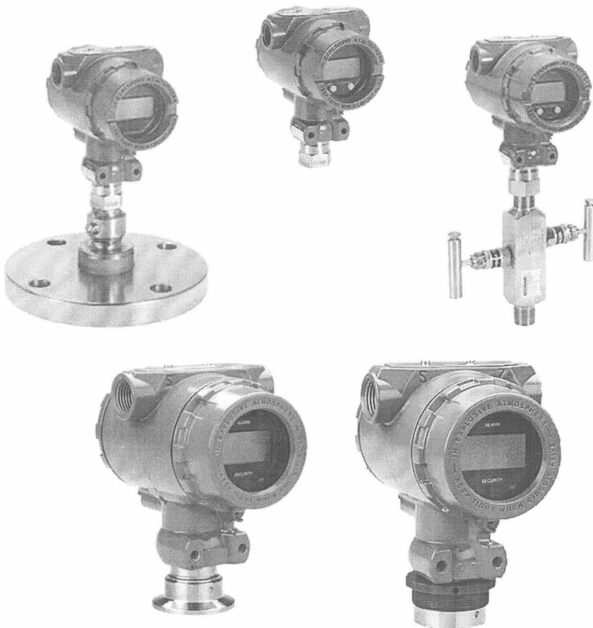
Рисунок 1 – Внешний вид преобразователей

Место нанесения знака поверки в виде клейма-наклейки приведено в Приложении А к описанию типа.