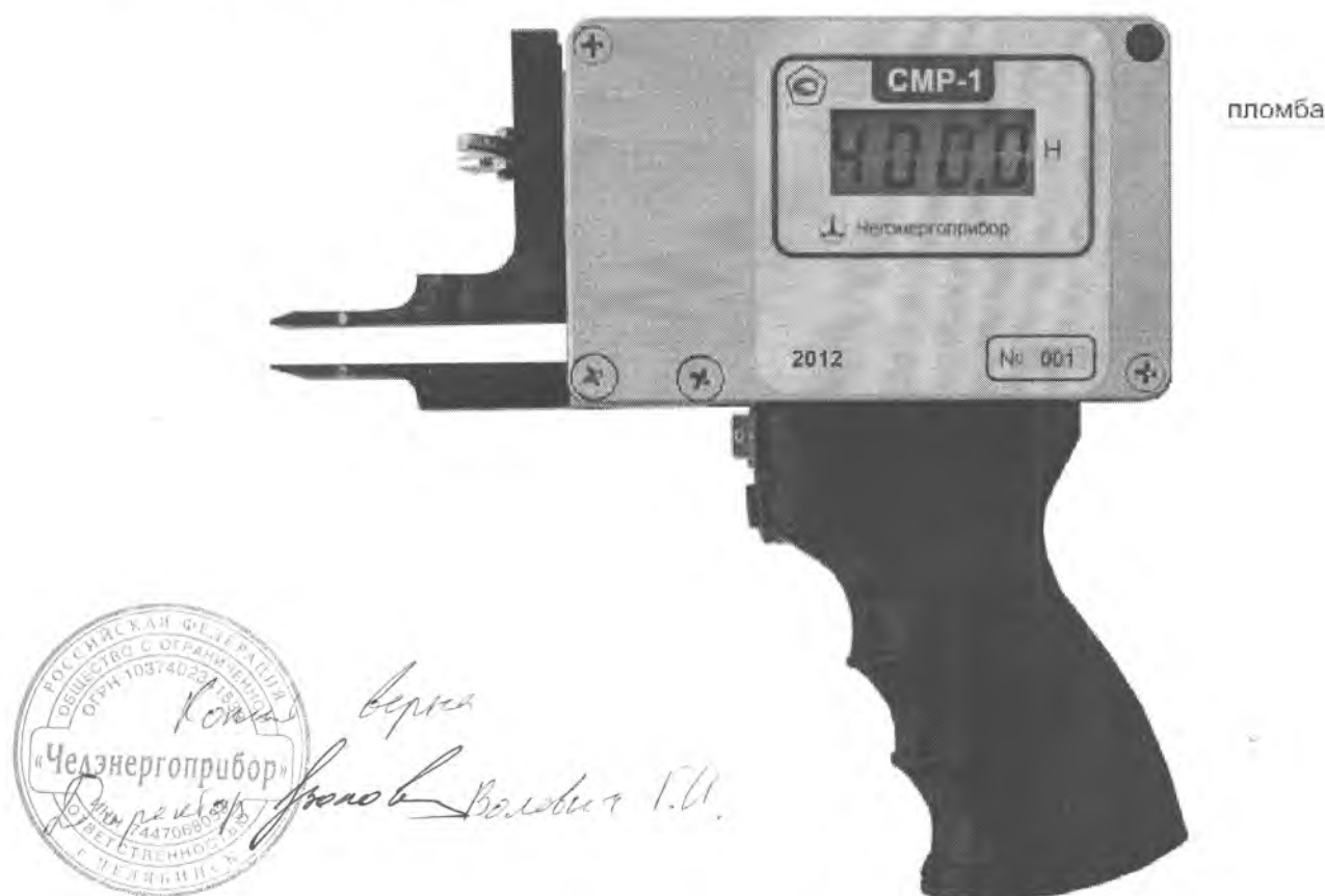
Рисунок 1 - Внешний вид прибора СМР-1

Вывод данных осуществляется на четырехразрядный семисегментный жидкокристаллический индикатор, смонтированный в корпусе.