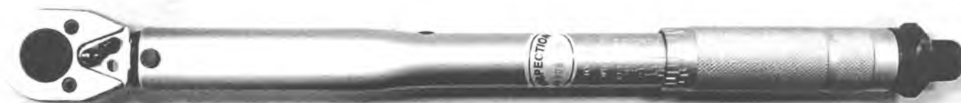
Рисунок 1 – Внешний вид ключей

Место нанесения поверительного клейма-наклейки приведено в приложении А.