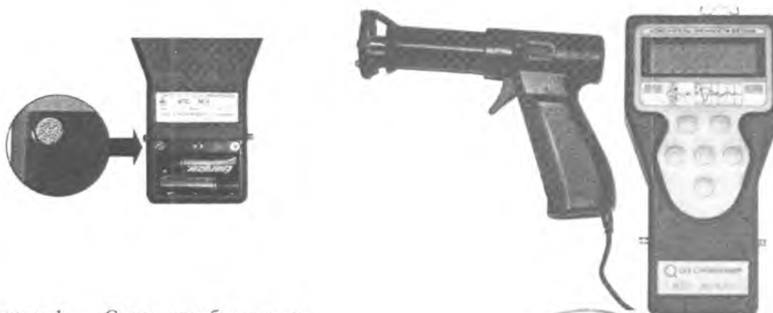
Рисунок 1 – Схема пломбировки от несанкционированного доступа и обозначение места для нанесения оттиска клейма

В модификации ИПС-МГ4.02 преобразователь (ударный механизм) снабжен устройством автоматического взвода бойка.