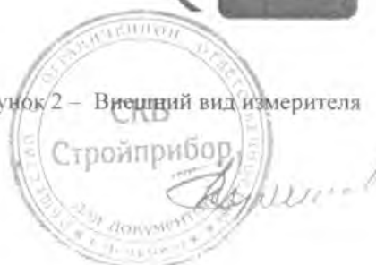
Рисунок 2 – Внешний вид измерителя