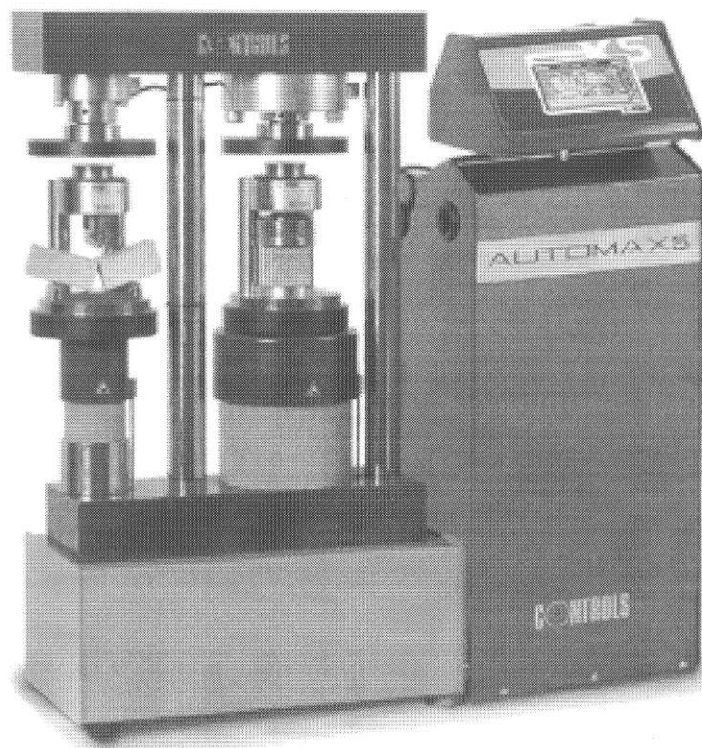
Рисунок 1. Машина силоизмерительная для испытаний строительных материалов серии L исполнения 65-L1352.

Внешний вид машин силоизмерительных для испытаний строительных материалов серии L приведен на рисунке 1.