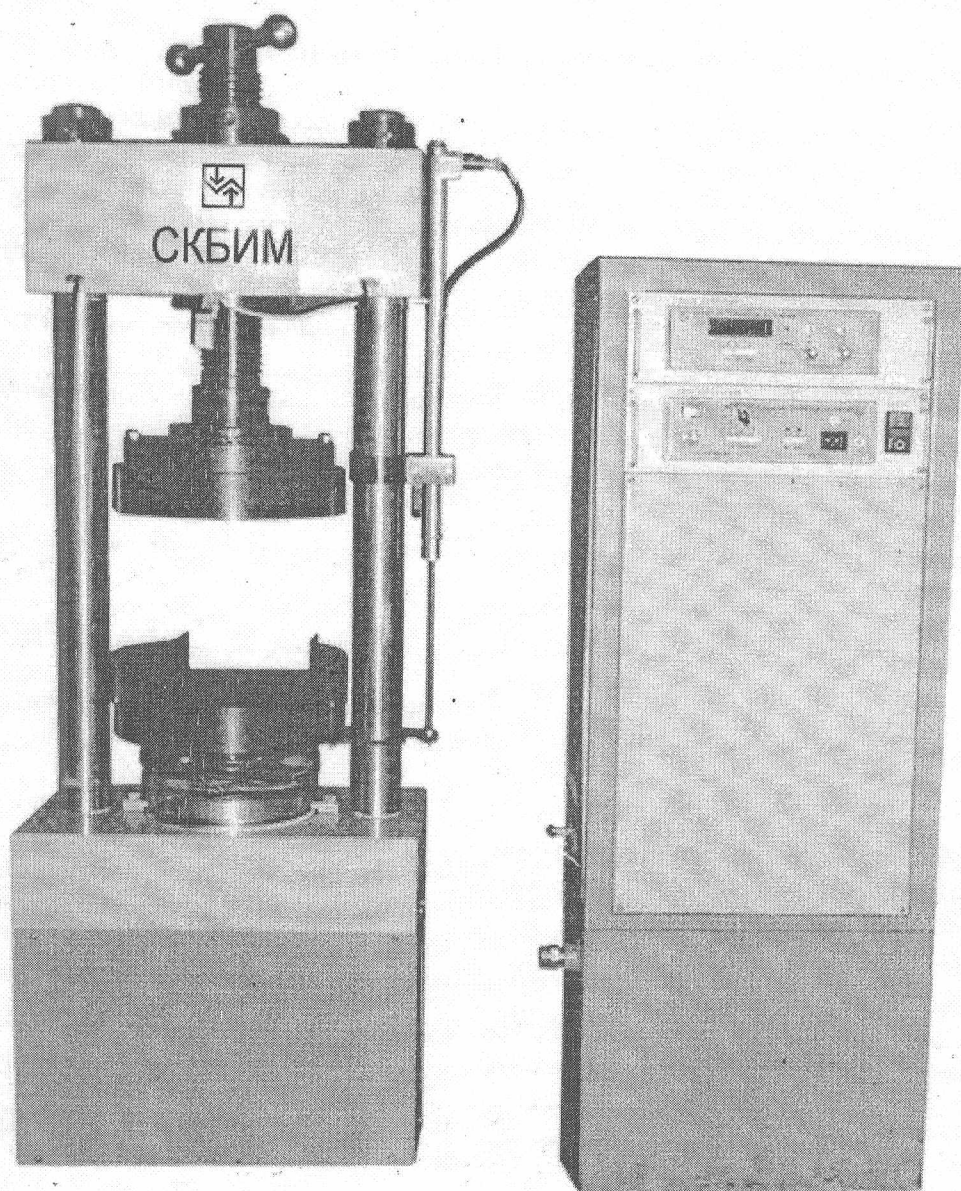
Рисунок 1 Общий вид машины типа ИПэ