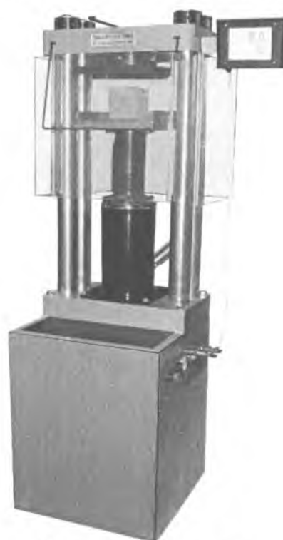
Рисунок 2. Общий вид