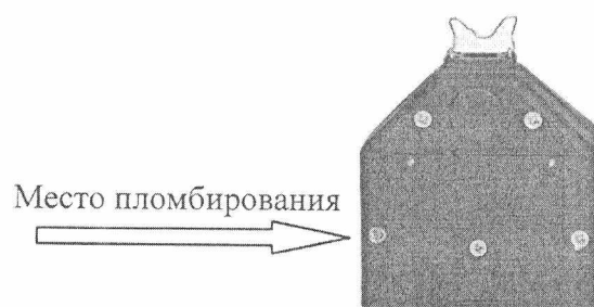
Рисунок 2 – Схема пломбировки от несанкционированного доступа и обозначение места для нанесения оттиска клейма