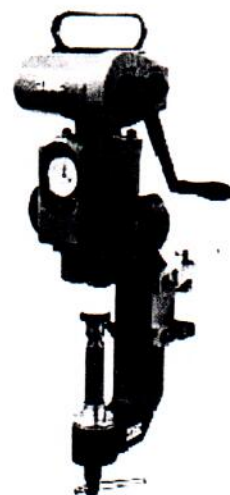
ТБП 5013 Рис. 2