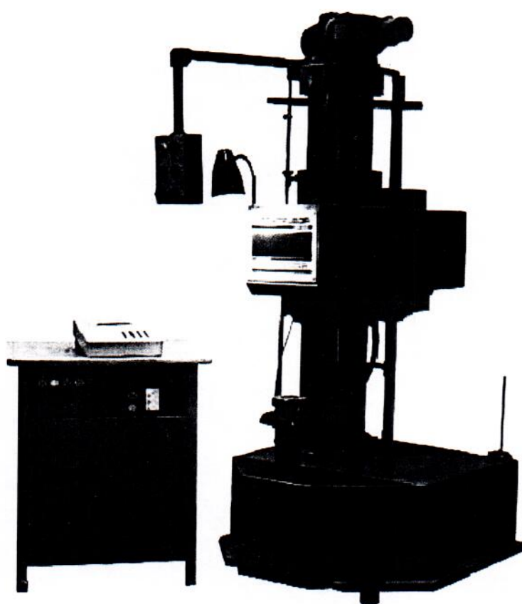
ТБ 5056 Рис.3