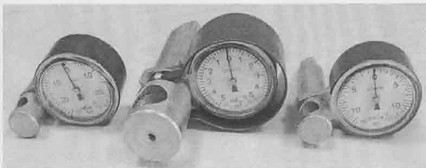
Рисунок 1 – Внешний вид ключей динамометрических (моментных) МТ.