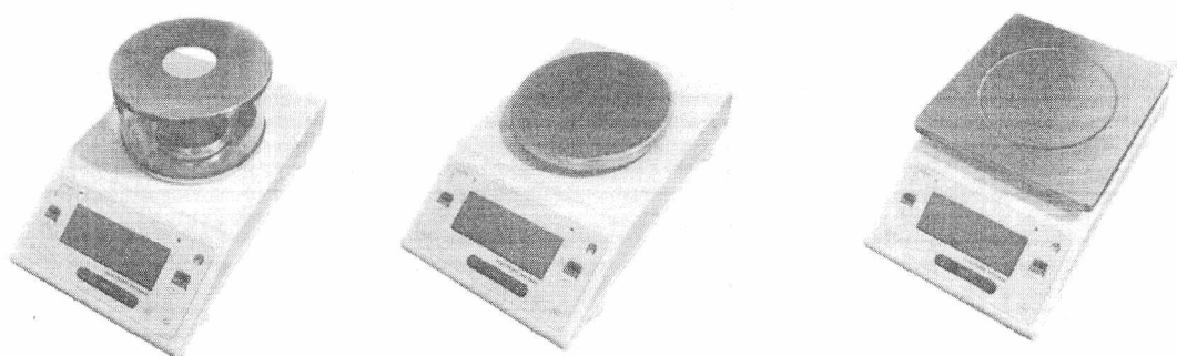
Рисунок 1 – Общий вид весов неавтоматического действия DL

Принцип действия весов основан на преобразовании деформации упругого элемента датчика, возникающей под действием силы тяжести взвешиваемого груза в аналоговый электрический сигнал, пропорциональный его массе. Далее этот сигнал преобразуется в цифровой код и обрабатывается. Результаты взвешивания выводятся на дисплей.