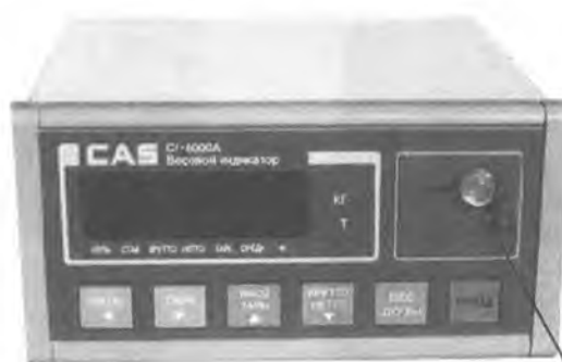
Индикатор CAS CI-6000A