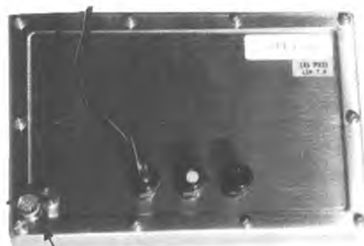
Индикатор CAS CI-2400BS