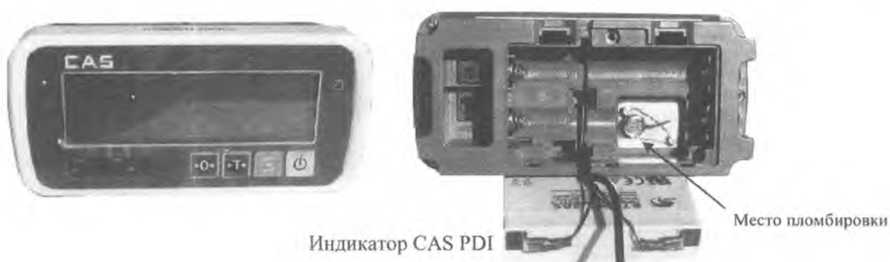
Рисунок 2 – Место пломбировки весов