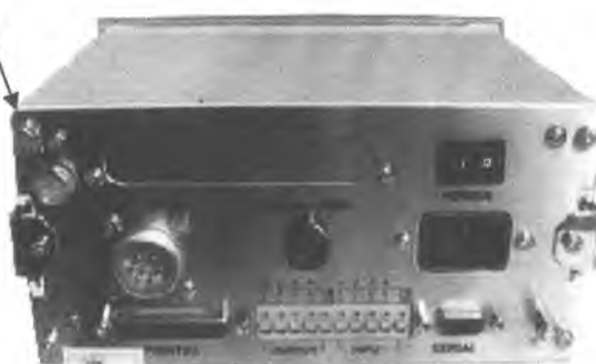
Индикатор CAS CI-5200A