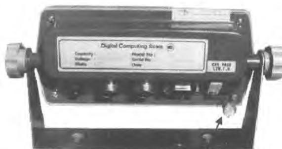
Индикатор CAS CI-2001A