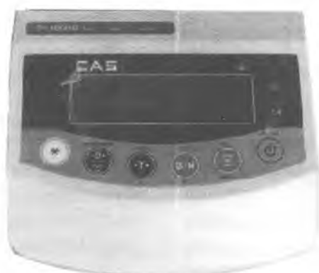
Индикатор CAS NT-200A