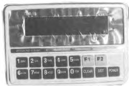
Индикатор CAS CI-2001A