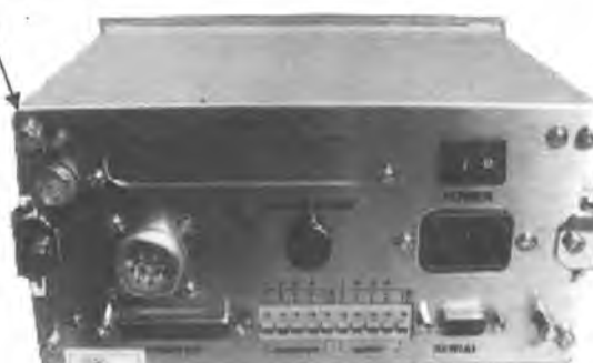
Индикатор CAS CI-5200A