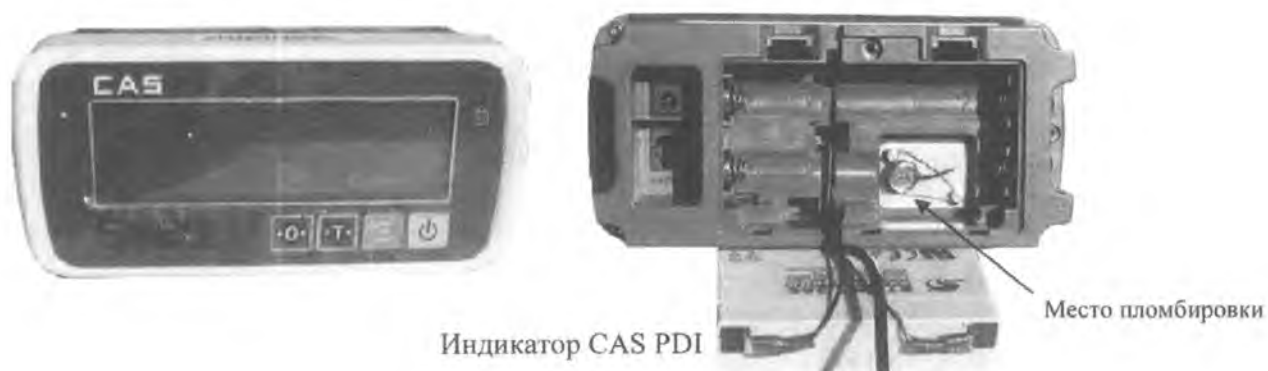
Рисунок 2 – Место пломбировки весов