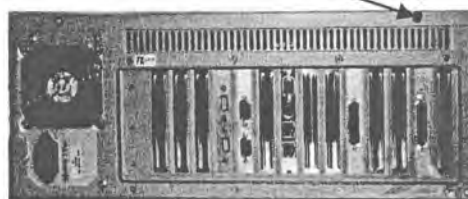
Рисунок 4 – Схема пломбировки индикатора М1РС-01 и терминала М1РС-03