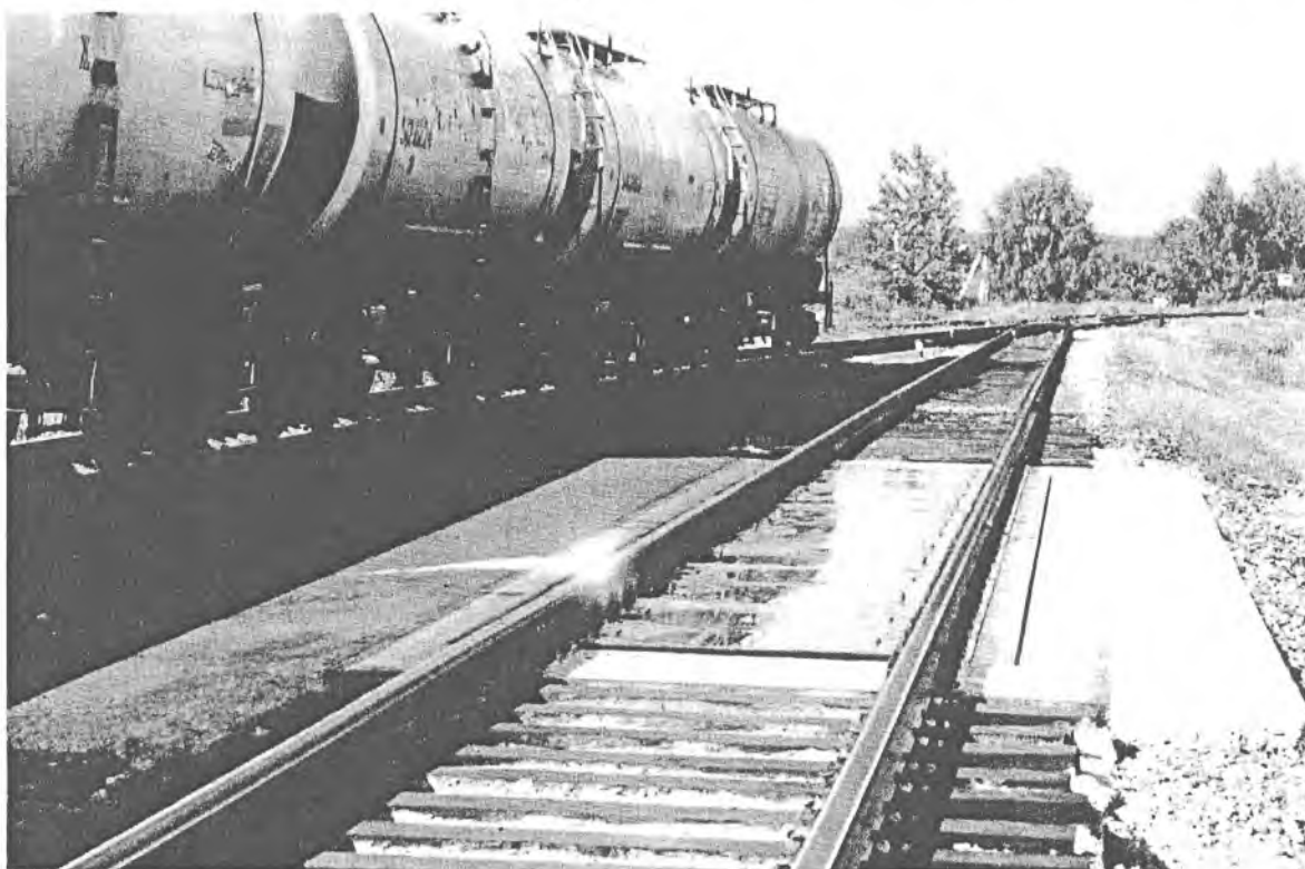
Рисунок 1 – Общий вид ГПУ весов

Сигнальные кабели датчиков подключены к электронному весоизмерительному устройству через клеммную и распределительную коробки.