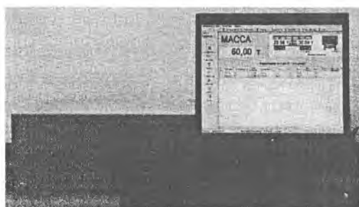
Рисунок 2 – Общий вид индикатора М1РС-01 и терминала М1РС-03