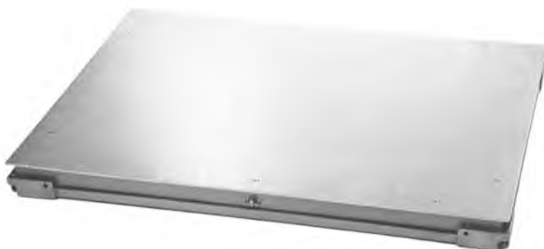
Грузоприемное устройство весов PG (PGV):