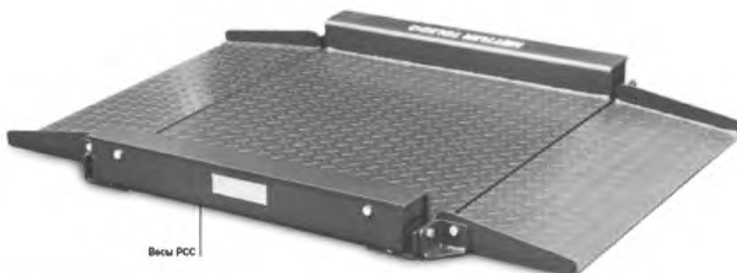
Грузоприемное устройство весов PCS: