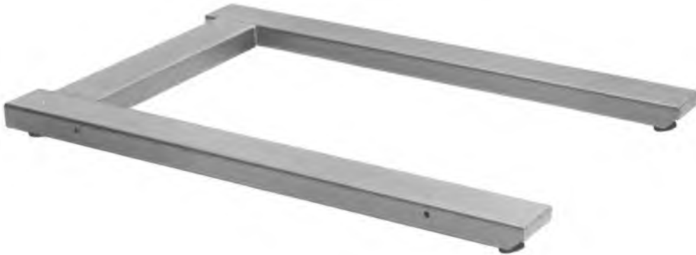
Грузоприемное устройство весов РUA (mobile):