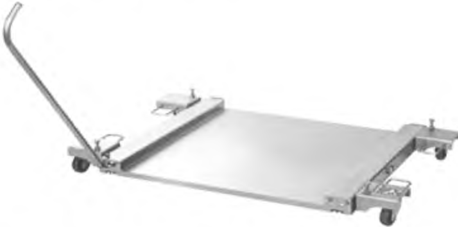
Грузоприемное устройство весов РUA: