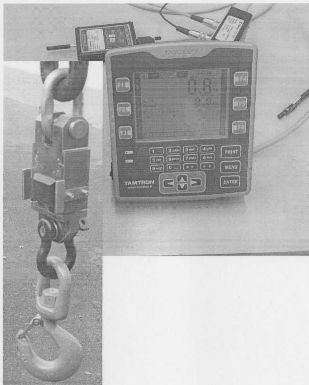
Рисунок 1. Внешний вид весов крановых ANV